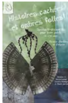
Histoires cachées... 4 à 9 ans Spectacle-animation: théâtre d'ombres et d'objets 2008 - 2011