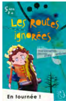
Les Routes ignorées 5 ans et + Marionnettes, ombres et livres animés 2012 - ...