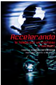
Accelerando 12 ans et + Théâtre d'ombre contemporain 2015